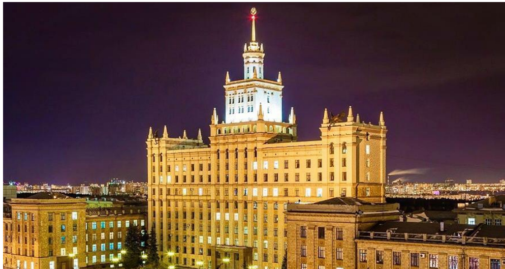
Южно-Уральский государственный университет (ЮУрГУ)