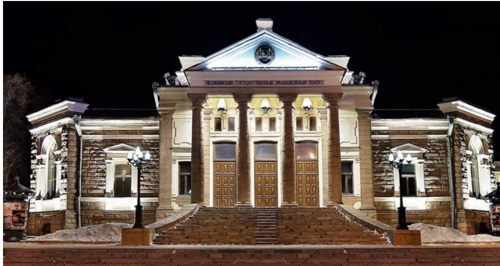
Челябинский молодежный театр