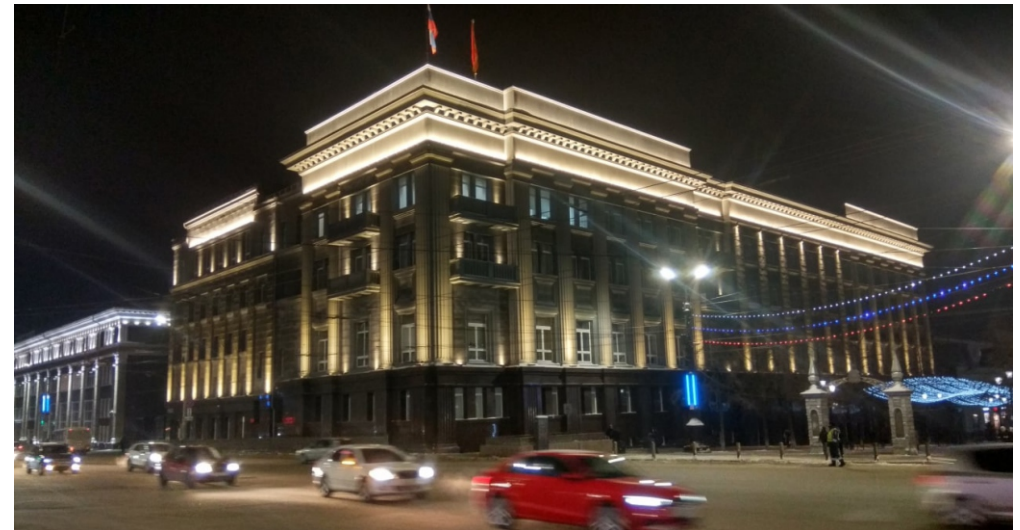
Здание Законодательного Собрания Челябинской области